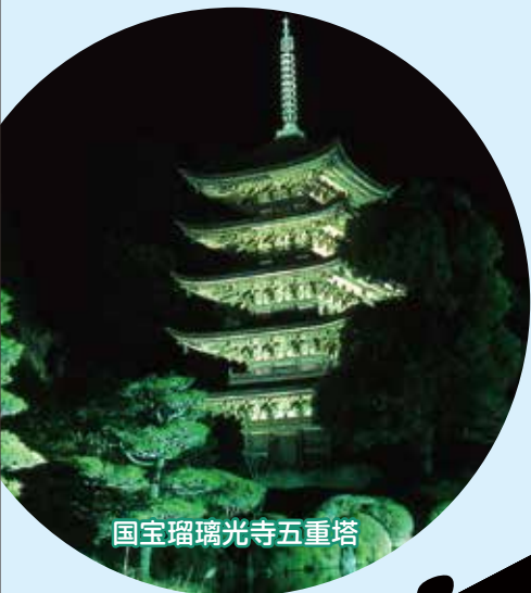
国宝瑠璃光寺五重塔