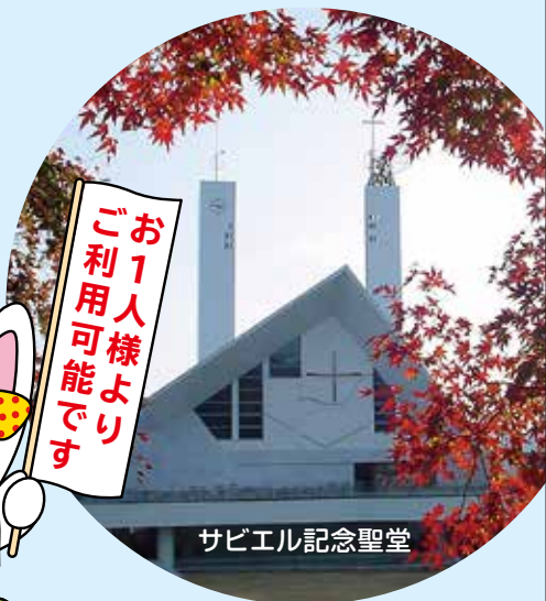
サビエル記念聖堂