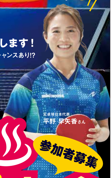
元卓球日本代表 平野 早矢香さん

今年のスリッパ卓球は“ダブルスのみ”で開催します! 「一般の部」と「未経験者の部」の2カテゴリーで、誰にでも優勝のチャンスあり!